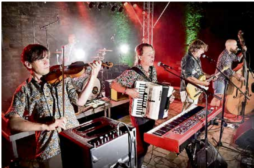
Die Band M. Walking on the Water in ihrer derzeitigen Besetzung bei einem Auftritt auf Burg Linn im Jahr 2019.